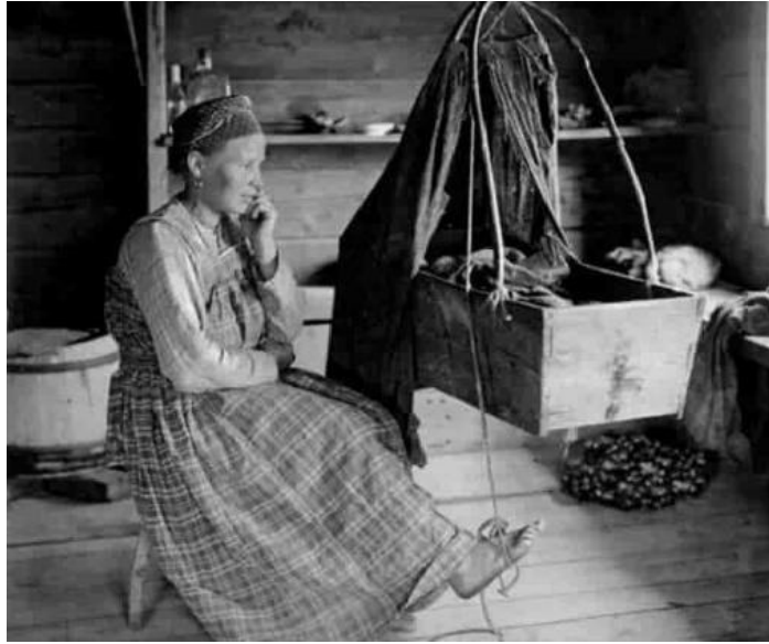
Рис. 1 Фотография женщины-крестьянки с колыбелью Картина В.И. Сурикова «Взятие снежного городка» (Рис. 2) запечатлела народную забаву в последний день Масленицы.