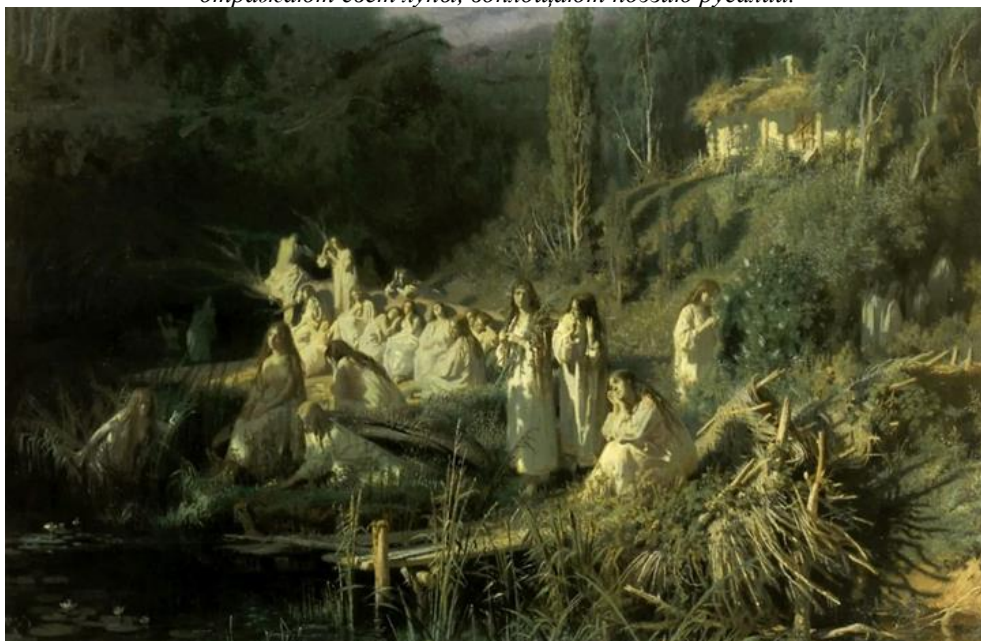
Рис. 4 Русалки (1871). И. Крамской

Наконец, на картине И. Крамского русалки будто сливаются с окружающим пейзажем, отражают свет луны, воплощают поэзию русалий.