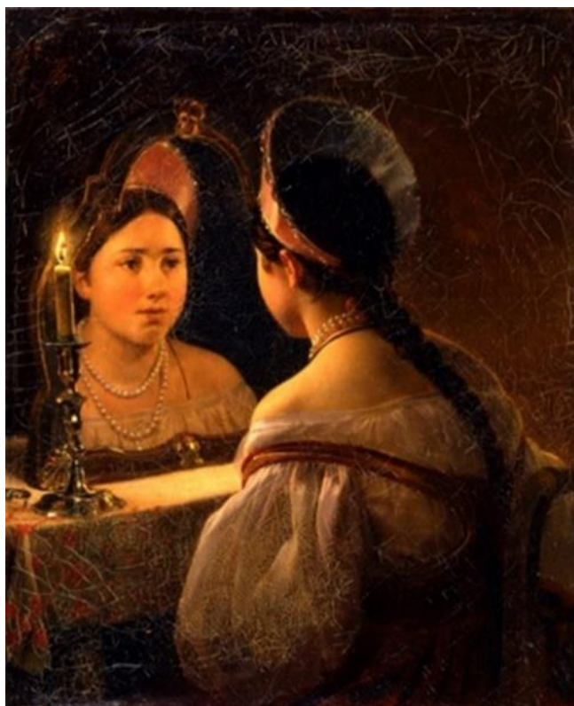
Рис. 3 Гадающая Светлана (1836). К. Брюллов

Наконец, на картине И. Крамского русалки будто сливаются с окружающим пейзажем, отражают свет луны, воплощают поэзию русалий.