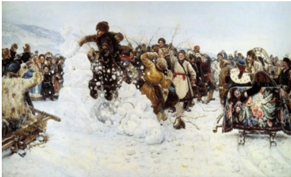
Рис. 2 Взятие снежного городка (1891). В.И. Суриков В изображении К. Брюллова (Рис. 3) девушка-крестьянка гадает у зеркала со свечой. Поэт-романтик В.А. Жуковский, творец Светланы, вдохновлялся русским фольклором, когда писал одноименную балладу.